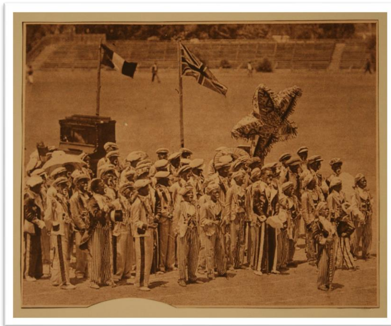
'Kaapse Klopse' van 1933 – Baie opleiding en beplanning word geveer om 'n parade te reël